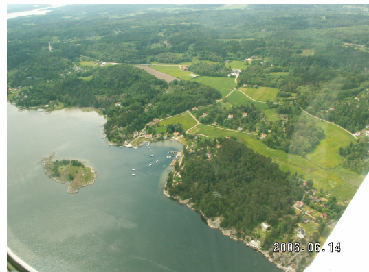
Stillingsön von oben juni 2006