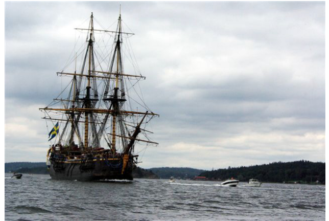
Götheborg med kurs mot Göteborg