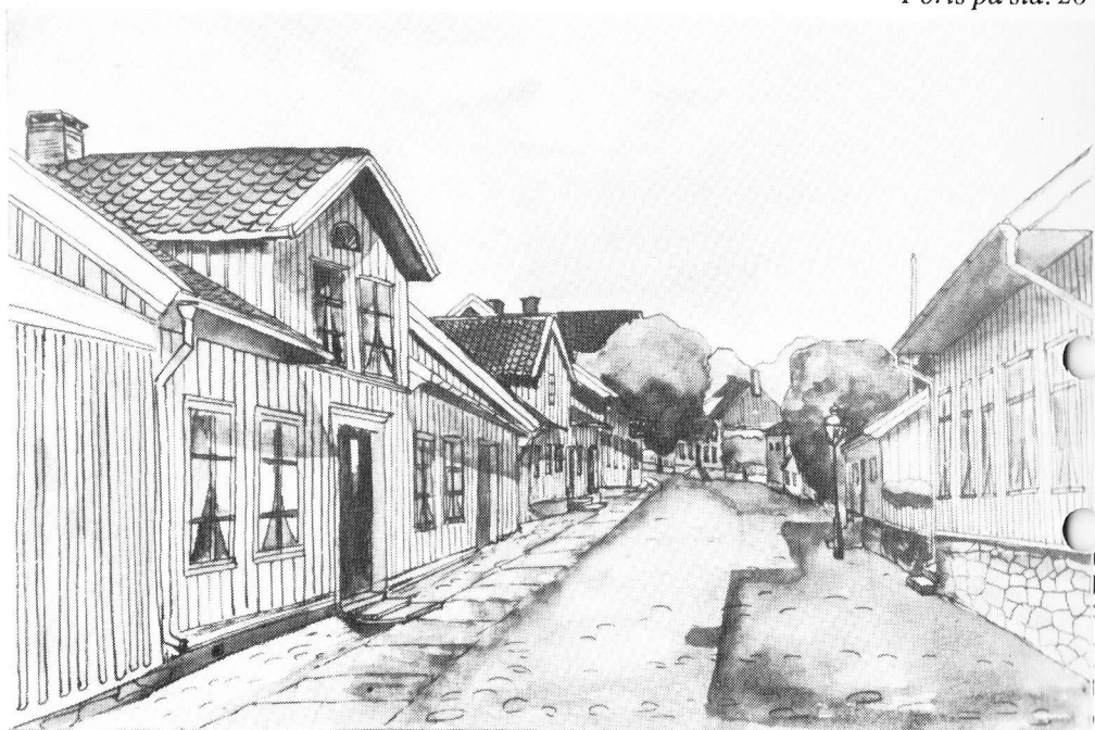
Gatubild från Kungälv